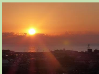
平成29年元旦 初日の出