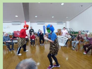
2月3日 デイケア節分