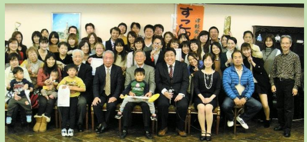
平成 27 年 12 月 18 日 忘年会

老健施設でゆっくりと「遊行期」を過ごそうと考えて居た事と大分かけ離れた現実であったとも思うが、良きスタッフに支えられながら楽しく過ごせたことを以て、これが私の「遊行期」なのであったと思ひ、心から感謝しつつ施設長を終えようと思って居る。2017 年 1 月 31 日